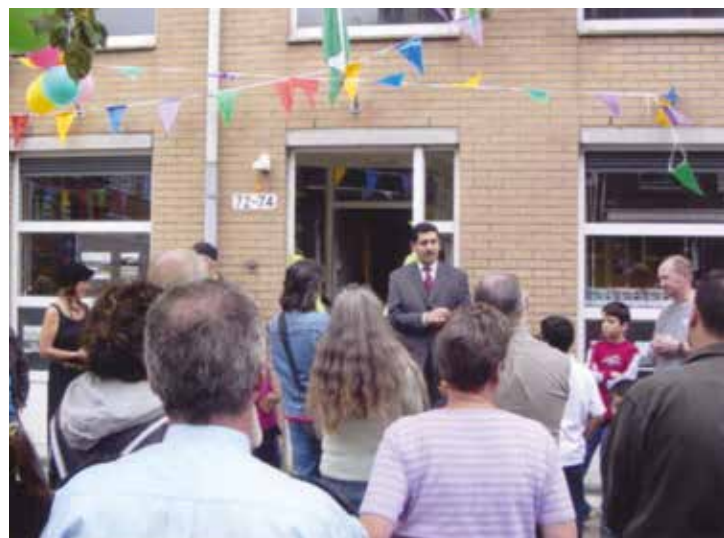
Opening van het pand in de Willebrordusstraat in 2004

Na de Stadsvernieuwing speelden er andere dingen bij de bewonersorganisatie zoals jeugdactiviteiten, de komst van een ESSO-station aan de Gordelweg, de start van de eerste Rotterdamse 'Krajicek Playground' (Koningsveldeplein), de ontwikkeling van de Hofpleinlijn ('Vrienden van den Hofpleinlijn'). Voor elk onderwerp was er wel een groep vrijwilligers die het oppakte, vaak samen met de bewonersorganisatie en het opbouwwerk. Er kwam meer samenwerking met Bewonersorganisatie Bergpolder, zoals bij straatvernieuwingprojecten, geveltuinen, de tuinen aan de Gordelweg, informatie over funderingsproblemen; de Buurtwinkel werd opgezet, activiteitenruimte 'De Vrije Ban' ging open. Begeleid door het opbouwwerk werd er serieus en hard gewerkt, ondersteund door administratieve krachten. In samenwerking met vrijwilligers die zich voor één of enkele projecten inzetten kwamen er heel wat straat- en wijkactiviteiten tot stand, voor jongeren en voor ouderen. Tegelijkertijd legde men (nieuwe) informele contacten met buurtbewoners en bood men ruimte voor enthousiaste groepen in De Vrije Ban. Er werd met plezier veel werk verzet, door bestuur en betrokken vrijwilligers.