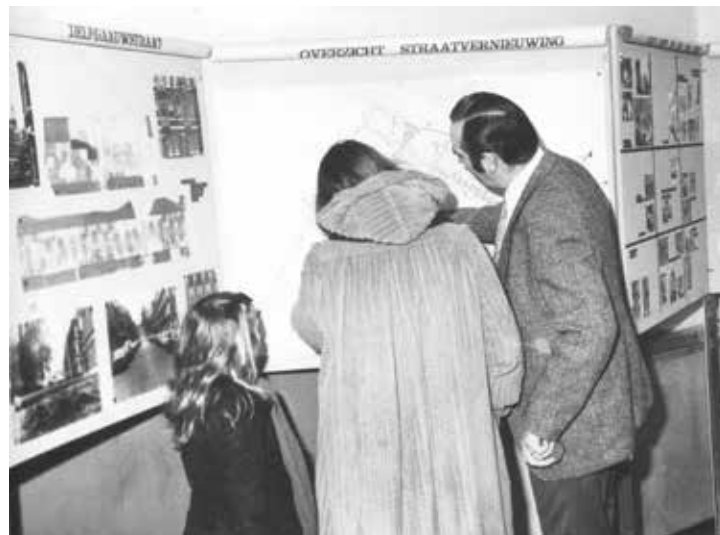
Informatie-avond over de Stadsvernieuwing in Liskwartier in 1980

Ondertussen werd door de gemeente bezuinigd op het welzijnswerk en daarmee ook op ondersteuning voor de Rotterdamse bewonersorganisaties. Het ging zover, dat de BOL vanaf 2014 geen professionele ondersteuning meer kreeg, maar door de gemeente geacht werd op alle gebieden even actief te blijven, zonder verhoging van de – toch al geringe – subsidie. Zo zette de BOL zich in – op verzoek van de gemeente – voor verbetering van de leefbaarheid van het Koningsveldeplein, vrijwel uitsluitend met hulp van vrijwilligers, met positief resultaat. Er kwam ook verandering in de subsidiebasis voor bewonersorganisaties; de administratie werd ingewikkelder en tijdrovender. De brede doelstellingen kwamen onder druk te staan. De relaties met het (gewijzigde) gemeentelijke apparaat werden minder intensief en minder effectief.