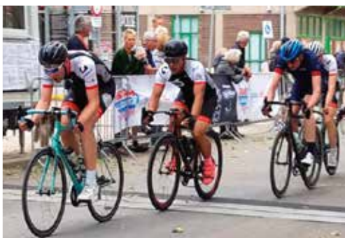
Wielrennen terug bij Ronde van Noord, pag. 5