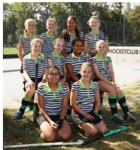
Meisjesteam C1 van HC Delfshaven

in de wijk geven we ook lessen op basisscholen via de verschillende Schoolsport Verenigingen. Op deze manier kunnen ze een beetje proeven aan de hockeysport om te zien of het wat voor ze is. Maar je kunt je via de website ook aanmelden voor een gratis proefles, zodat je vrijblijvend een keer mee kunt trainen. Iedereen is welkom! Op zaterdag 28 september kunnen kinderen in de wijk kennis met ons maken bij Happy2Move, het sportfestival op de Bergselaan. Hockeysticks, hockeyballen en doeltjes liggen op jullie te wachten.