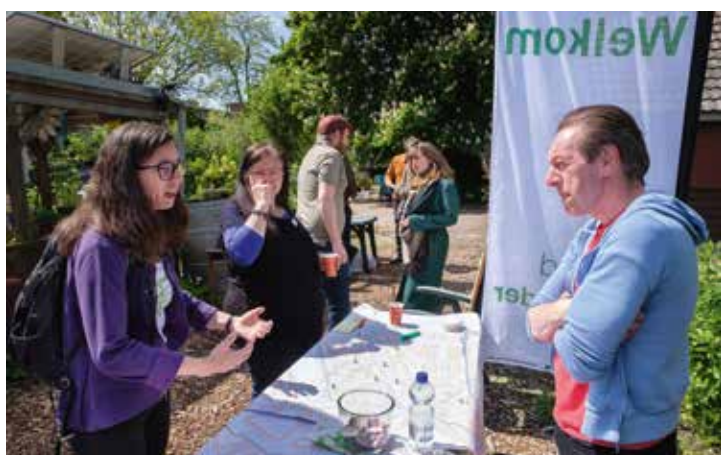
Leden van de wijkraad Bergpolder in gesprek met bewoners uit de wijk tijdens de Geveltuinendag