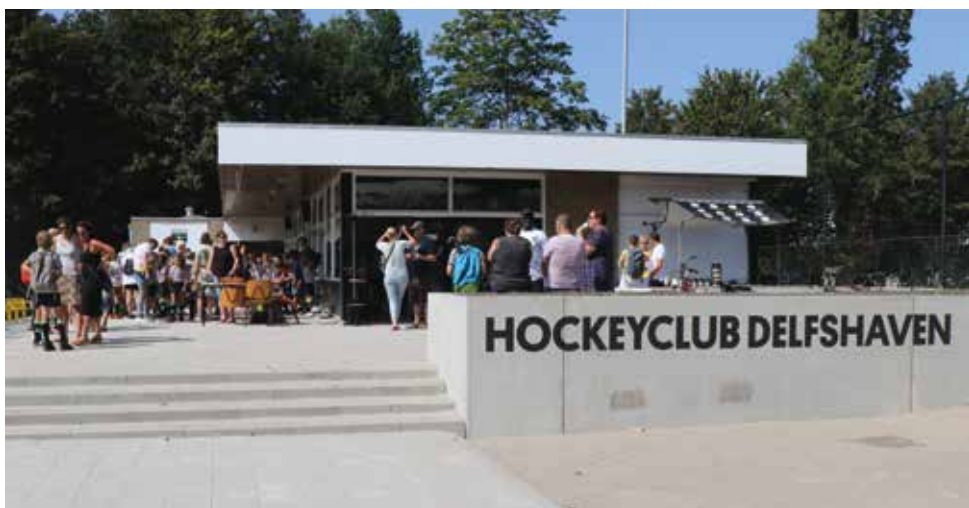
Het clubgebouw van HC Delfshaven