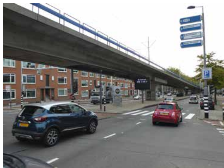
De entree van de stad op de Schieweg, bij de Gordelweg