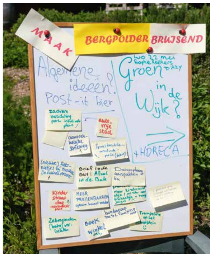
Suggesties van wijkbewoners voor Bergpolder