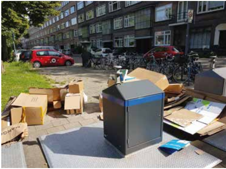
Troep bij de vuilcontainers op de Noorderhavenkade

Het probleem met zwerfafval staat de laatste tijd in Rotterdam volop in het nieuws. De wijkkrant ging voor u op zoek naar het afvalprobleem in Bergpolder.