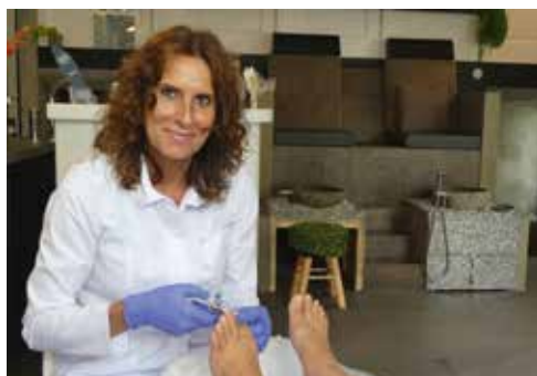
Voetvolk pag. 11

Wijkkrant voor en door bewoners • september 2019 • nummer 18