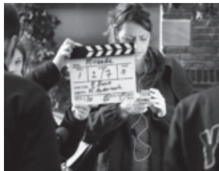
Miranda!, korte film uit Bergpolder – pagina 16