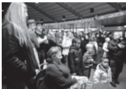
Een volle Terraszaal tijdens de nieuwjaarsreceptie.