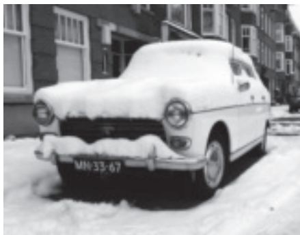
Winterfotowebstrijd: de winnaars – pagina 11