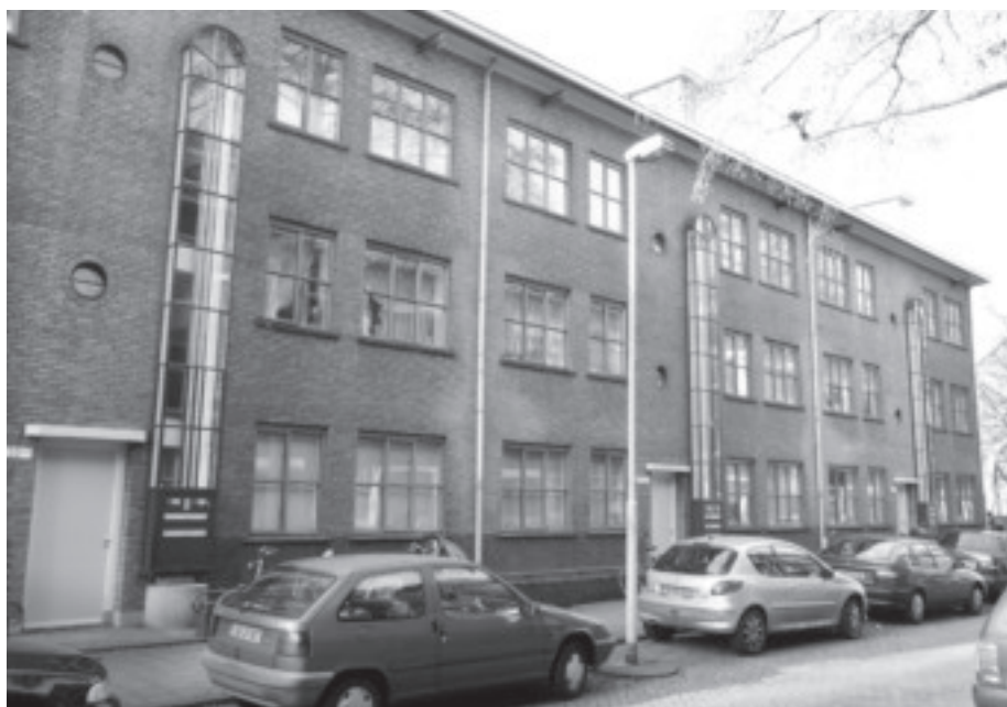
Het Abraham Kuyperlaan Complex: Delftse School.

In Bergpolder liggen de iconen van twee bouwstijlen nu al bijna tachtig jaar gemoedelijk naast elkaar. Rijksmonument de Bergpolderflat staat voor Het Nieuwe Bouwen en het Abraham Kuyperlaan Complex (een gemeentelijk monument) voor de Delftse School. Misschien maakt juist de tegenstelling tussen beide stijlen het geheel wel extra opvallend en interessant. Bergpolder is de plek die laat zien dat beide stijlen wel degelijk goed samen kunnen gaan.