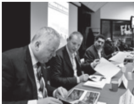
Kom naar het politiek café – pagina 3