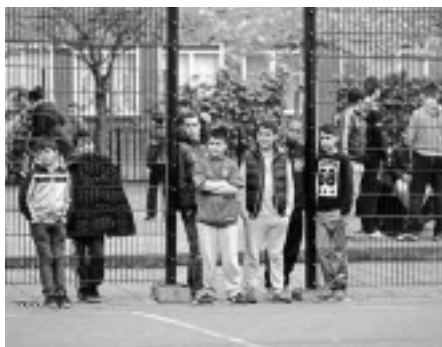
Koningsveldeplein in beweging, pag. 3