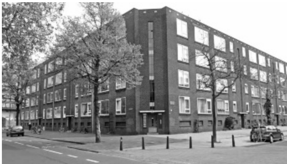
De PWS-blokken op de hoek van de Bergselaan en De Savornin Lohmanlaan.

Het is voor het eerst dat huurders op deze schaal hun krachten bundelen om een serieuze gesprekspartner te zijn in onderhandelingen voor behoud van de woningen. Eigenaar Vestia heeft hen te kennen gegeven pas in 2016 een beslissing te nemen over de