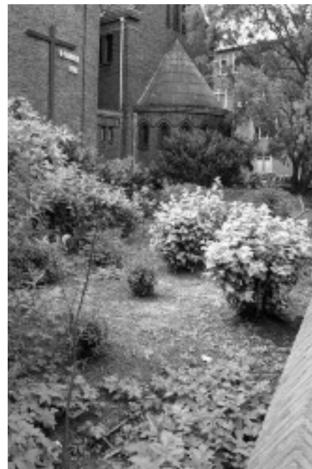
De kerktuin na

Nu we dit schrijven, schiet het onkruid omhoog en waait het eerste vuil alweer de tuin in, de inzet van tuinsamaritanen blijft hard nodig. We blijven de ontwikkeling rond de tuin volgen en hopen dat zich gauw een