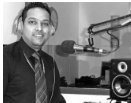
Multiculturele RadioOmroep Stanvaste, pag. 16