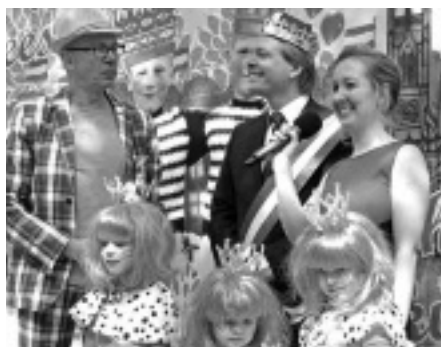
Liskwartier viert Koningsdag, pag. 4