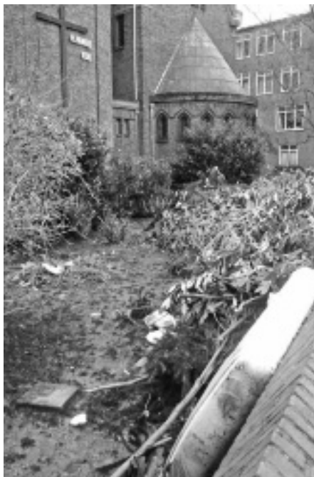
De kerktuin voor

Volgens onbevestigde berichten (het is vakantie en niemand is bereikbaar) zou ook de nabij gelegen Imeldaschool bereid zijn te werken aan het groene aanzicht van de kerktuin.