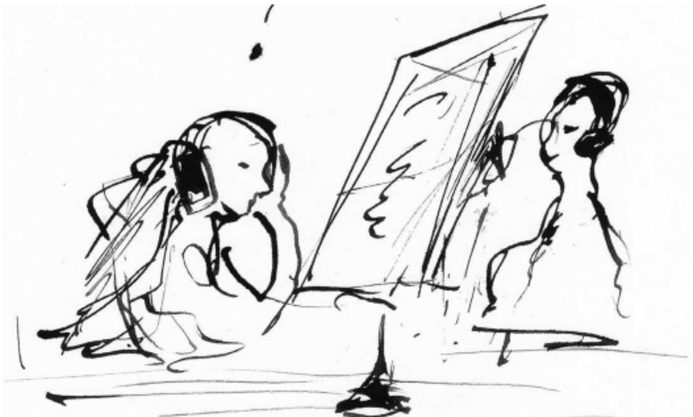
Illustratie Annelies de Greef