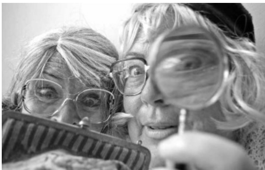
Oma's op zoek

Kom gerust langs om het theater en de expositie te bekijken en zie voor uitgebreide info en programmering www.studiodebakkerij.nl