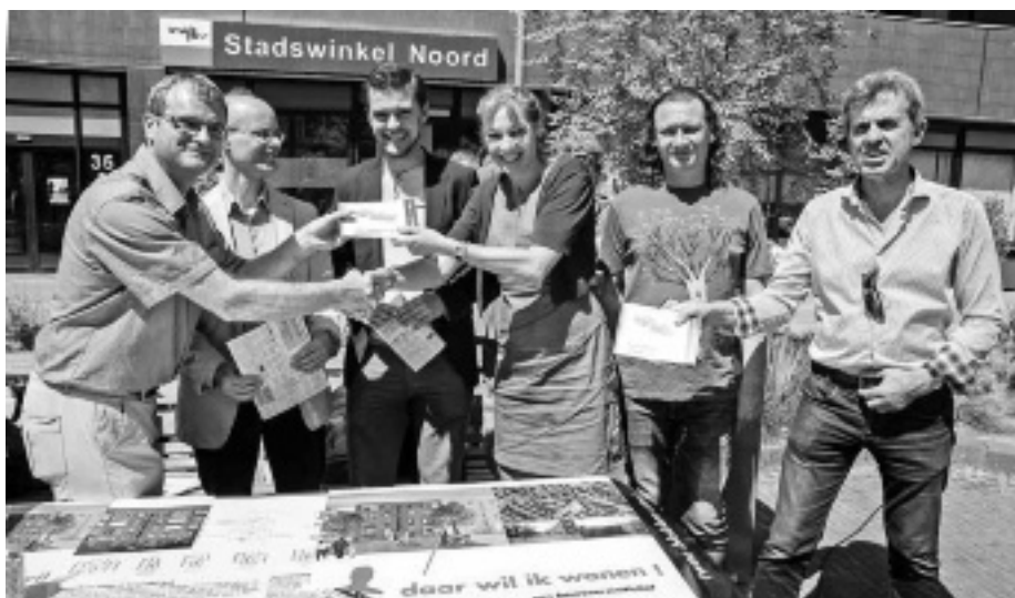
Bewoners van de PWS-blokken overhandigen hun ideeën aan vertegenwoordigers van de gebiedscommissie en de gemeenteraad