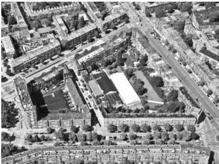
Luchtfoto van het Van Maanenblok, met duidelijk zichtbaar het Van Maanenbad (bij witte tent)

Half maart werden de eerste resultaten van het onderzoek gepresenteerd aan bewoners en belangstellenden uit de wijk. In samenwerking met Stedin, Stichting Kien en een masterstudent Duurzame Energietechnologie van de TU Eindhoven is het huidige energieverbruik berekend. Wat blijkt: de bewoners van het blok gebruiken meer energie dan gemiddeld in Nederland. Er verdwijnt veel warmte door de slecht geïsoleerde vloeren, muren en daken. Maar er wordt ook meer elektriciteit verbruikt. Dat komt waarschijnlijk doordat weinig mensen zich bewust zijn van het relatief hoge verbruik van oude apparaten. Duidelijk is dat er nog veel bespaard kan worden en dat moet ook want dat maakt investeringen in opwekcapaciteit rendabeler. Gemiddeld kan eenderde van de elektriciteitsbehoefte van de huishoudens geogst worden met zonnepanelen op de daken van de panden.