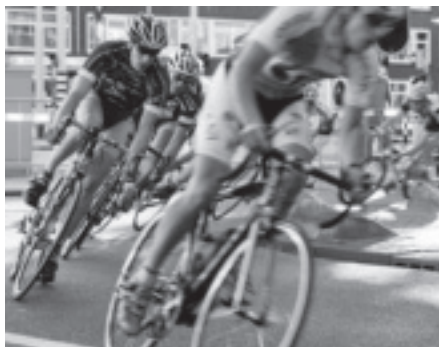
De wielerronde is terug - pagina 12-13