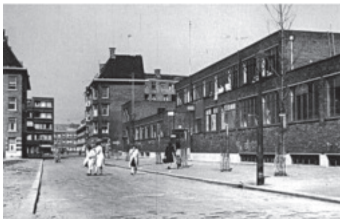
Van Maanenbad (voorgevel en buitenbad)

De Bergsingelkerk opent haar deuren voor Open Monumentendag op zaterdag 11 september. Alle informatie over open gestelde monumenten in de stad vindt u op www.openmonumentendagrotterdam.nl en in de brochure die verkrijgbaar is bij o.a. de bewoners-organisaties.