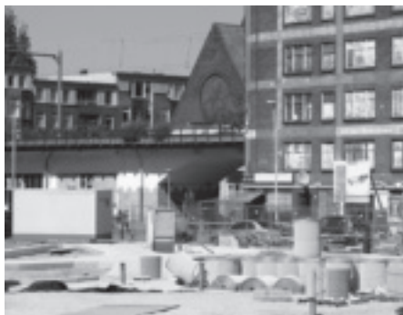
BP3738: Krachtwijk in uitvoering - pagina 5