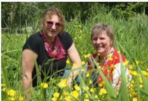
De Stad Uit pag. 4