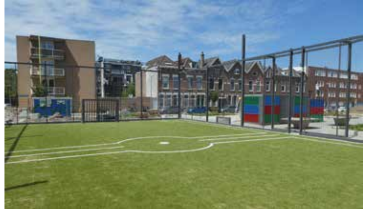
De nieuwe voetbalkooi op het Koningsveldeplein

Vanaf 19 juli is het plein weer klaar voor gebruik; spelen, zitten en sporten. In november plant de gemeente de bomen en struiken, want dat is het beste moment om dit te doen.