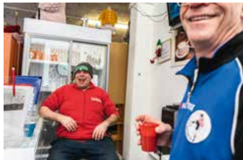
'Onbekende leefwerelden in Centrum'

De foto blijkt onderdeel te zijn van De Kracht van Rotterdam : een continue foto-expositie op verschillende plekken in Rotterdam. Door heel Rotterdam hangen grote foto's die een ander beeld van de stad laten zien dan de overbekende plaatjes als skyline, Erasmusbrug, Markthal en Koopgoot.