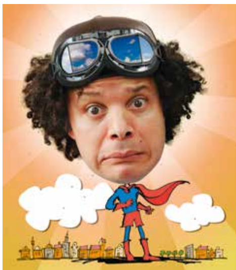
Hakim op z'n best

Wat kun je allemaal doen op maandag, woensdag en vrijdag van 10.00 tot 16.00 uur? Villa Zebra geeft verschillende workshops, er wordt voorgelezen, je kunt lekker dansen, muziek maken en zingen.