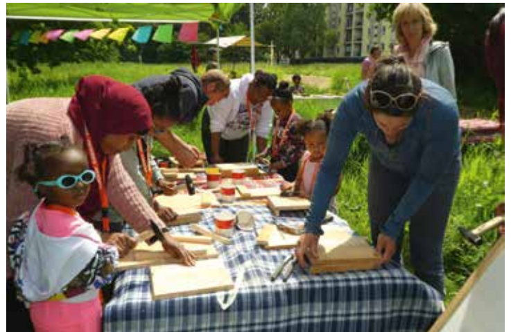
Kinderen en hun ouders maken samen vleermuiskastjes