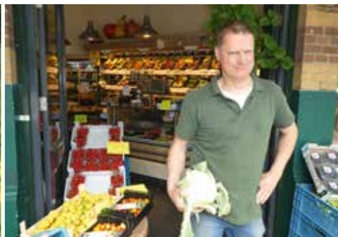
Bekende winkels verdwijnen pag. 14 en 15