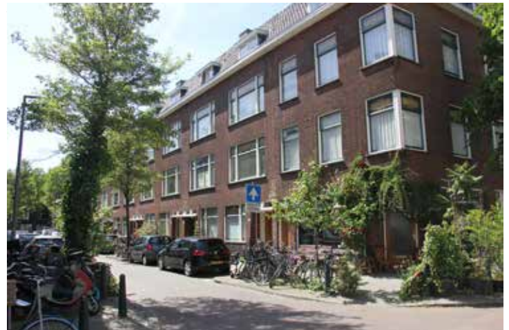
Vestia-woningen in De Kempenaerstraat

De planning van Vestia is nog niet helemaal duidelijk. Volgens Hans wil Vestia na de zomervakantie beginnen met het voeren van gesprekken met de bewoners. Overigens kan de bewonerscommissie HKT door middel van rechtszaken de boel nog wel flink vertragen. Het is dan zaak dat de bewoners blijven weigeren de opzegging van het huurcontract te tekenen. Op dit moment zijn 36 van de 61 hoofdhuurders tegen het plan. Zover is het nog niet, men zit nog in de 'minnelijke fase'.