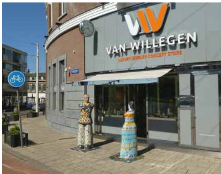
‘Jut en Juul’