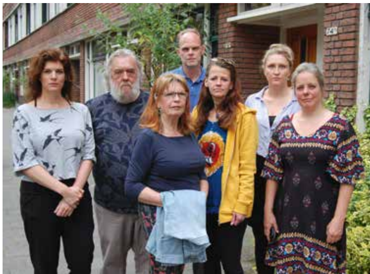
Bewoners van de bewonerscommissie HKT