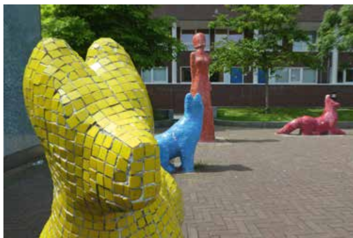
‘Vrouwe Insulinde en haar honden’ op het Insulindeplein