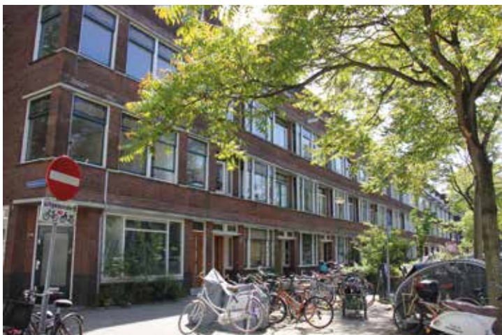
Vestia-woningen in de Talmastraat