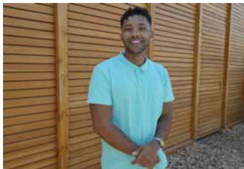
Jongeren ontwikkelen passie pag. 5

Wijkkrant voor en door bewoners • • juli 2019 • • • • • nummer 17