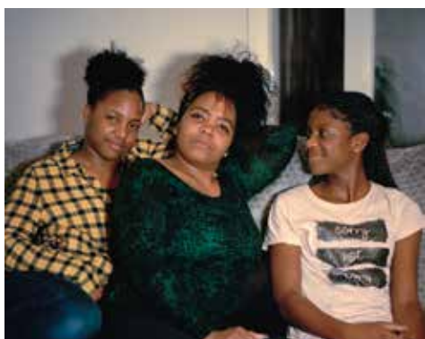
'Moeders en dochters'