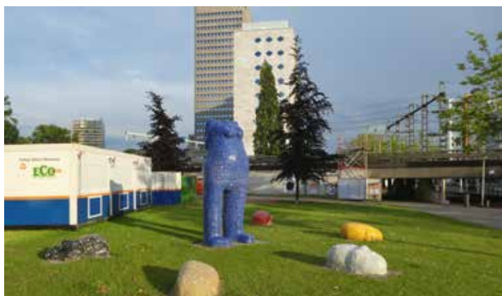
‘Vrijheid van Meningsuiting’ bij het Hofplein

“Ik ben in 1988 komen wonen in de Vrijenbansestraat en later in de Willebrordusstraat. De wijk verloederde in die tijd; ik woonde tussen dichtgetimmerde panden, tussen de ratten, junks en dealers, het was gevaarlijk op straat. Ik had toen een zoontje van vier en wilde dat hij prettig kon opgroeien. Dus ben ik mooie dingen gaan maken in de wijk, samen met andere bewoners want verbinding is belangrijk voor een prettige leefomgeving. Ik had onder andere een filmzaal in een garage in de Willebrordusstraat gemaakt, waar ik voor de jongens uit de buurt bijv. James Bondfilms in het Chinees draaide. Ook organiseerde ik voor die jongens voetbaltoernooien. Voor die tijd werd er veel gevochten in de buurt. later werd het leuker. En zo werd het dus ook leuker voor mijn zoontje en voor mij.”