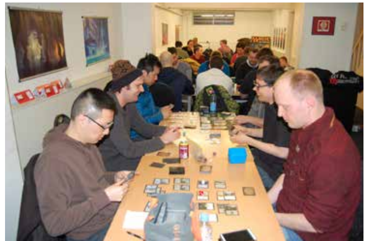
Op vrijdagavond zit de kelder van Magic United altijd bomvol