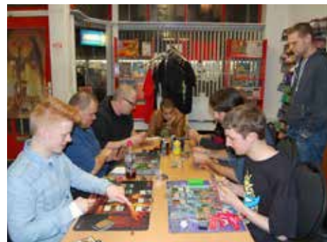
Magie verbindt pag. 16