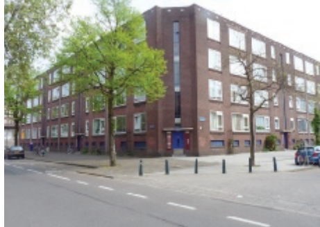
De PWS-woningen op de hoek van de Bergselaan en de De Savornin Lohmanslaan

bewonerscommissie in gesprek geweest met Vestia over de toekomst van de twee woonblokken. Berekeningen lieten daarbij zien dat sloop/nieuwbouw op deze locatie de minst aantrekkelijke optie was voor Vestia. De corporatie zelf wilde bovendien niet tot 2016 wachten met het nemen van een beslissing.