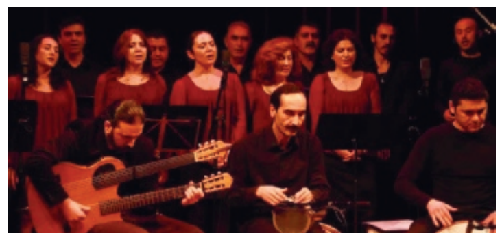
Rotterdam Yurttan Sesler Korosu