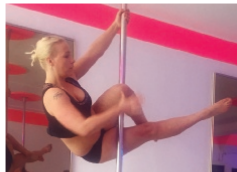
Paaldansen in Bergpolder pag. 12