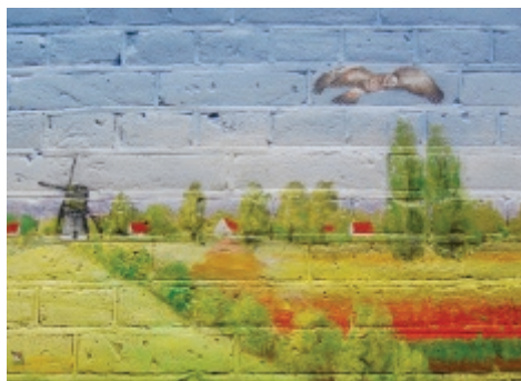
Kleur in de straat pag. 5