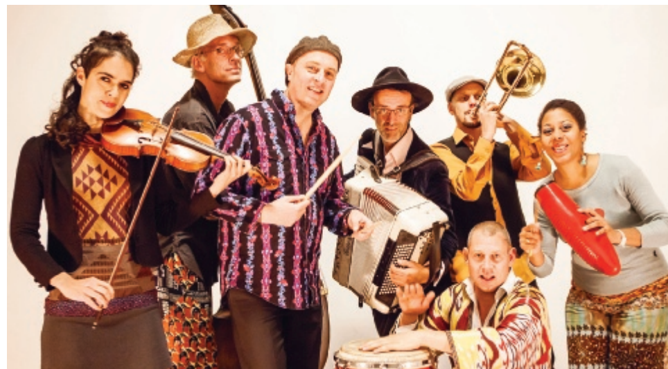
Yacumba swingt de pan uit met zomerse, Zuid-Amerikaanse muziek

Op de langste dag van het jaar is het weer een vrolijke boel in Bergpolder. De Bewonersorganisatie Bergpolder heeft deze dag uitgekozen voor haar jaarlijkse wijkfeest. Dit keer gaan we daarvoor naar het veld aan de Tak van Poortvlietstraat, tussen de Insulindestraat en De Savornin Lohmanlaan. Van 13 tot 18 uur zal er van alles te doen en te zien zijn.