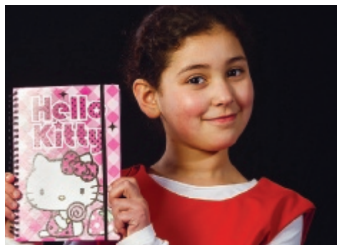
Liskinderen in beeld pag. 2

Wijkkrant voor en door bewoners / nummer 3 / juni 2015