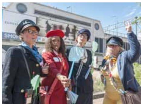
Het Langste Podium pag. 2

Wijkkrant voor en door bewoners / nummer 4 / september 2015