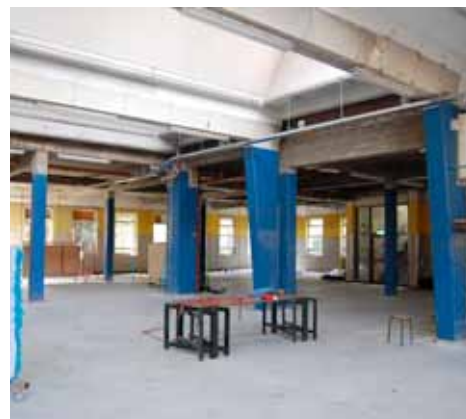
De oude wasserij op de Zuster Meijboomhof