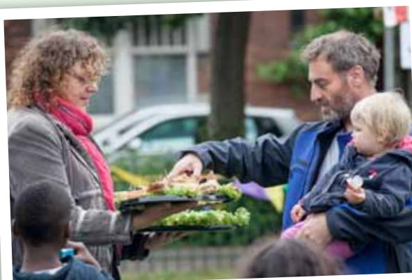
Lekkere hapjes voor alle bezoekers