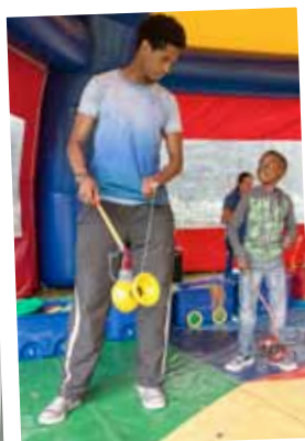
'n truc van Circus Hannes