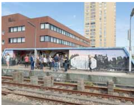
Het Bergwegstation was voor één dag weer even open