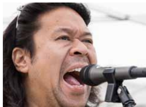
Wijkfeesten pag. 6 en 7