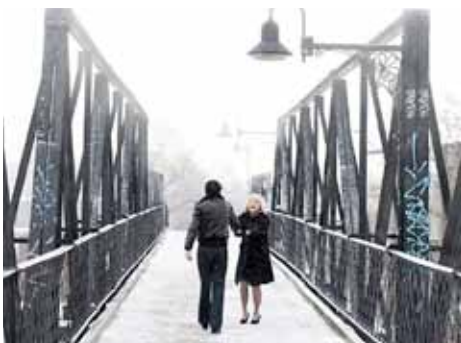
Films zien in Liskwartier pag. 5