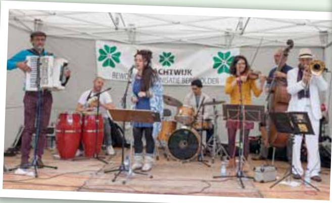
Yacumba speelde zonnige muziek