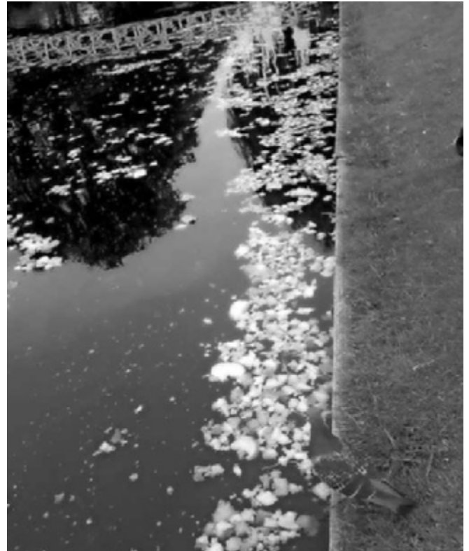
De Bergsingel volgegooid met brood

Teveel voer maakt dat er teveel vogels komen. Zoveel dat je van overbevolking kunt spreken. Als het zo blijft, moet de gemeente de vogels gaan vangen. Wat gebeurt er dan? De eenden worden gevangen en vervolgens elders geplaatst of vergast. Zo worden er hele eendengezinnen uit elkaar gerukt en dat verstoort het familieleven. Gun eenden dat ze in een goede gezond-