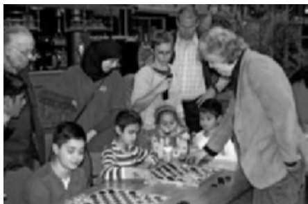
Dammer Ton Sijbrands is graag weer van de partij

Op zaterdag 20 september kunnen de bewoners van Rotterdam Noord bij Humanitas op de Bergweg terecht voor dammen, schaken, bridge en andere denksporten. De organisatie van de Denksportdag heeft dit jaar een paar grote namen voor haar evenement weten te strikken.