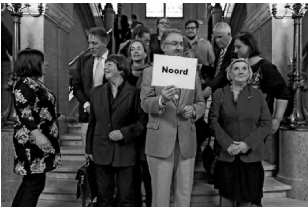
Gebiedscommissie Noord is geïnstalleerd door burgemeester Aboutaleb

voorgesteld: integrale straataanpak om de problematiek achter de voordeur aan te pakken. Andere ondersteuning (bijvoorbeeld door talentenjacht, ondersteuning bij schoolloopbaan) worden niet vermeld.