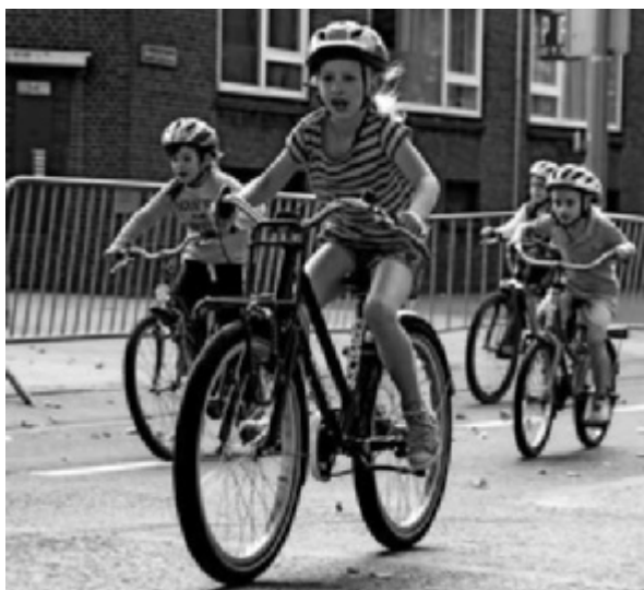
Dikke Banden Race

De Wielerronde van Noord viert dit jaar zijn eerste lustrum. Op zaterdag 27 september vinden op de Bergselaan diverse wielervedstrijden plaats voor jong en oud. Rondom het parcours zijn leuke attracties, zoals een kleine kermis, een braderie, een springkussen en een gezellig terras bij de Bergsingelkerk.