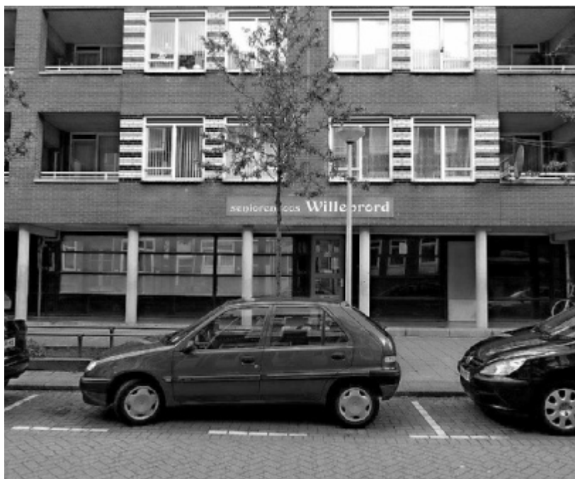
De Willebrordsoos in de Vrijenbansestraat

Sinds jaar en dag is de ruimte in de Vrijenbansestraat 50 bekend als de Seniorensoos Willebrord, in de volksmond beter bekend als de Willebrordsoos. Vorig jaar is het beheer van het pand overgenomen door de bewonersorganisaties Bergpolder en Liskwartier. De ruimte is hierdoor nu niet alleen voor senioren beschikbaar, maar voor ALLE doelgroepen in de wijken Bergpolder en Liskwartier. In de activiteitenladder op deze pagina ziet u voorbeelden van de huidige activiteiten, variërend van een kindermiddag, een schaakschool tot themabijeenkomsten over opvoeden.