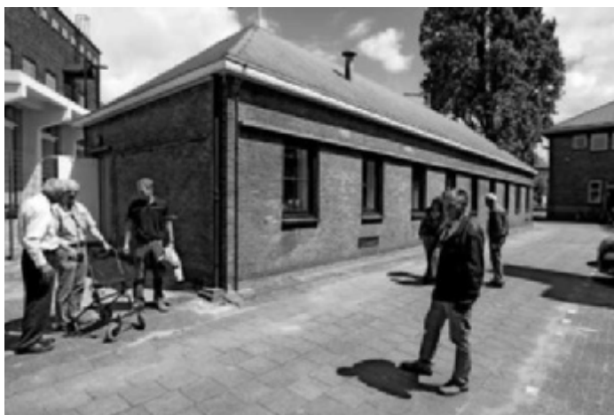
De Bunker op het terrein van de Telefooncentrale