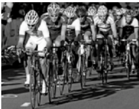
Noord Sport, pag. 2 t/m 5