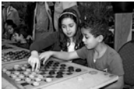
Kinderen kunnen ook dammen tegen de oud-wereldkampioen