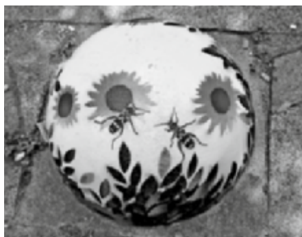
Parkeerbollen geschilderd, pag. 7