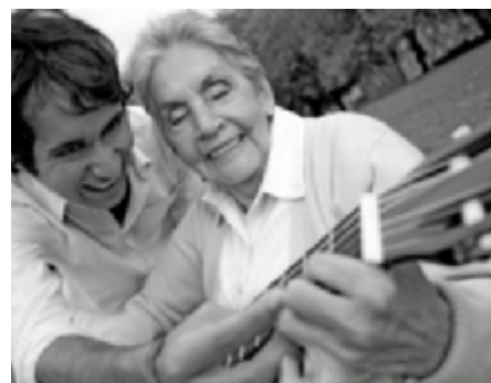
Gitaarles voor 65 plussers, pag. 9