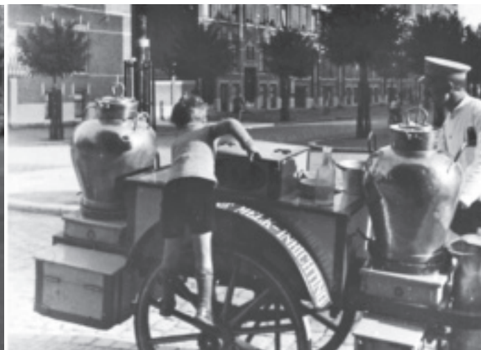
Bergselaan rond 1930