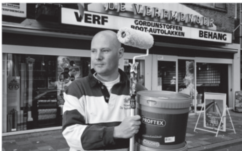
BERGPOLDER KRACHTWIJK WINKELIERS ANNO 2009

Bewonersorganisatie Bergpolder en Deelgemeente Noord