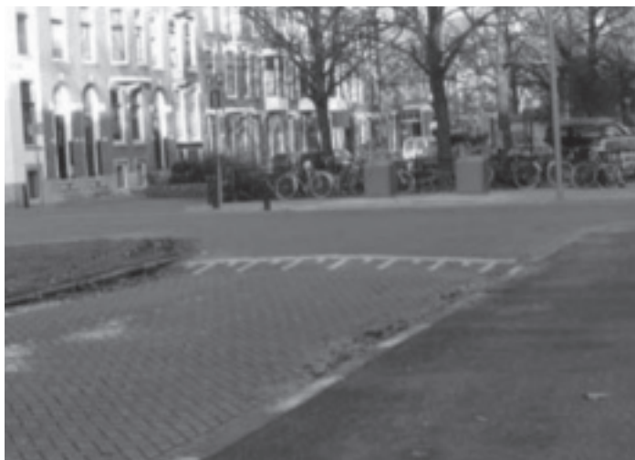
Bergselaan anno 2008