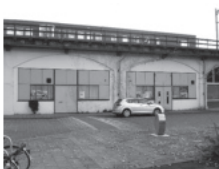
1 en 12 Nieuw buurtcentrum