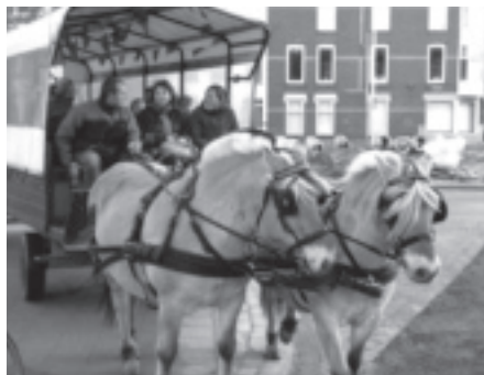
6. 30 jaar BOL