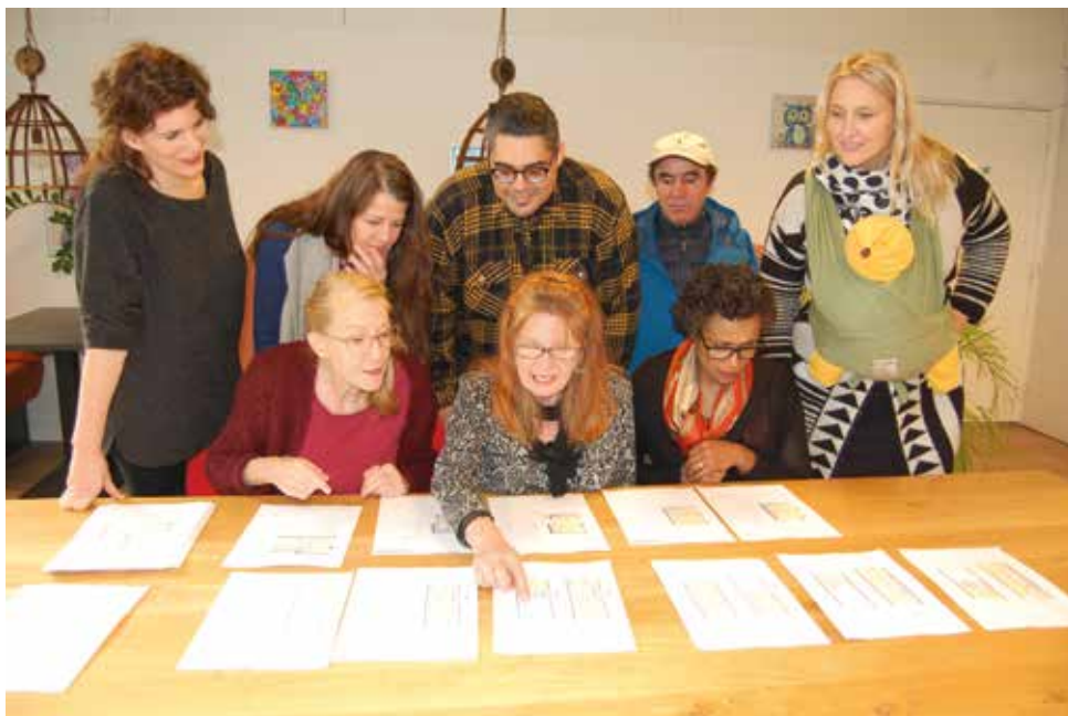
Bewoners van het HKT-blok bekijken de nieuwe bouwtekeningen

Woningcorporatie Vestia kondigde een plan aan voor grootscheepse 'renovatie' van het blok. De voorgevel, een beschermd stadsgezicht, zou blijven staan; achter de voorgevel zou alles worden gesloopt. De huurcontracten zouden worden opgezegd. Volgens het plan zouden veel bewoners er in woonruimte op achteruitgaan en de huren zouden worden verhoogd. Veel bewoners zouden niet meer kunnen terugkeren, want hun woningen waren voorbestemd voor de vrije sector. Dit was het begin van vele maanden van stress en onzekerheid. In juli berichtte de wijkkrant al over deze nijpende situatie. Hoe staat het er nu voor met de bewoners van het HKT-blok?