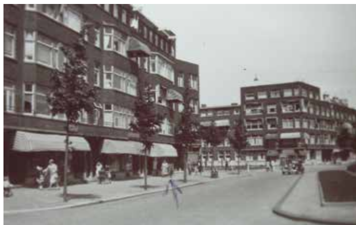
Bergselaan 1949, bij de pijl melkwinkel Bracht op 233-C