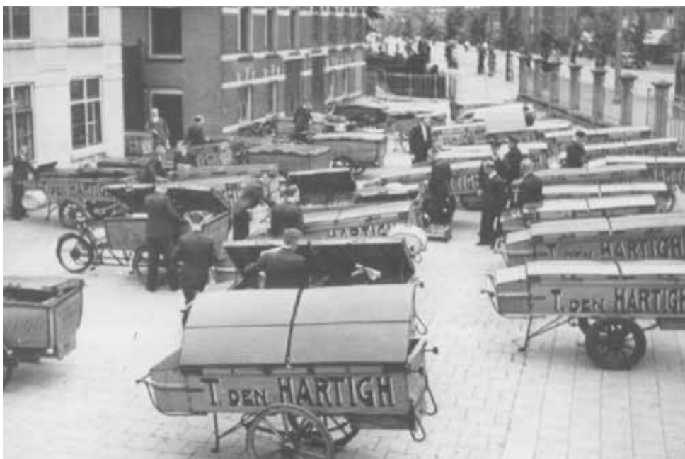
De broodkarren van Den Hartigh Bakkerijen

PS. Dit verhaal verscheen eerder in de wijkkrant van december 2016.