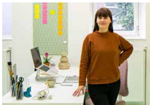
Modetalent in De Wasserij pag. 9

Wijkkrant voor en door bewoners • • december 2019 • • nummer 19