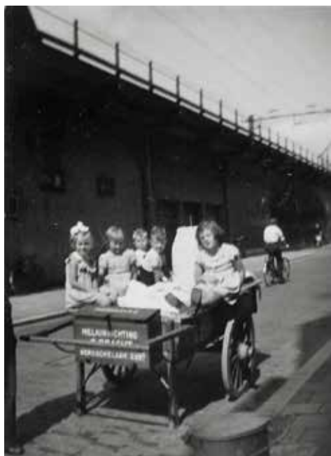
Kinderen op de handkar van 'Melkinrichting Bracht' in de Insulindestraat

“Het was keihard werken voor weinig, zes lange dagen in weer en wind buiten. Sterker nog, het werk als melkman is nooit mijn hobby geweest, ik had er zelfs een hekel aan, ik deed het vooral om mijn ouders te ontlasten.