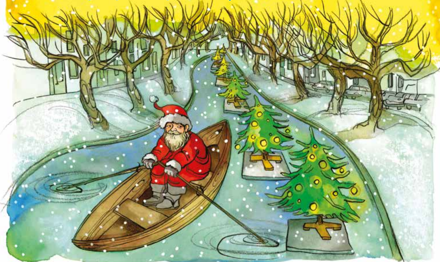
Illustratie: Helen van Vliet

De bewonersorganisaties van Liskwartier en Bergpolder en de redactie van de wijkkrant wensen je ... ... gezellige feestdagen en een fijn contact met de buren in 2020!