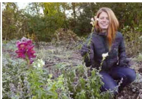
Passie voor natuur pag. 16