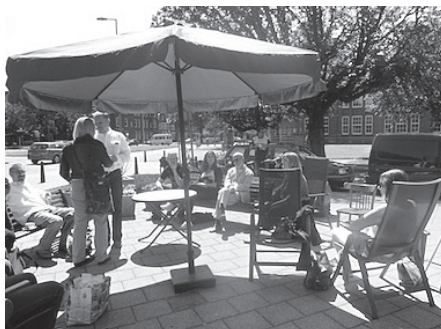
Zaterdagmiddag tijdens het Open Huis

De kerkdeuren staan wijd open. De zon straalt uit een strakblauwe hemel. Er klinkt vrolijke muziek van Fatal Blue. Mensen lopen heen en weer, drinken koffie of thee, praten met elkaar, binnen of op het terras. Dan gaat iedereen zitten en wordt het stil.