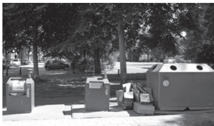
een brandende kwestie