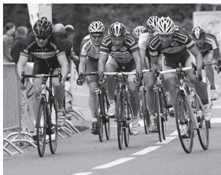
September Sportmaand – pagina 8 - 9