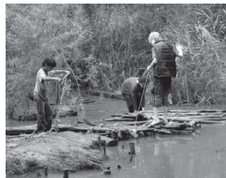
De Speeldernis – pagina 3