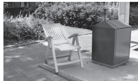
en het wachten is op ...