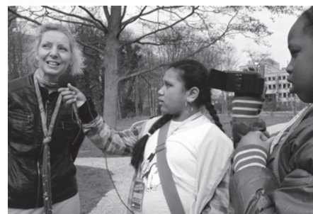
Wijkijgers in actie

Op 6 juni vond op de Kop van Zuid in Lantaren Venster de eindpresentatie van Hoedje van Papier plaats.