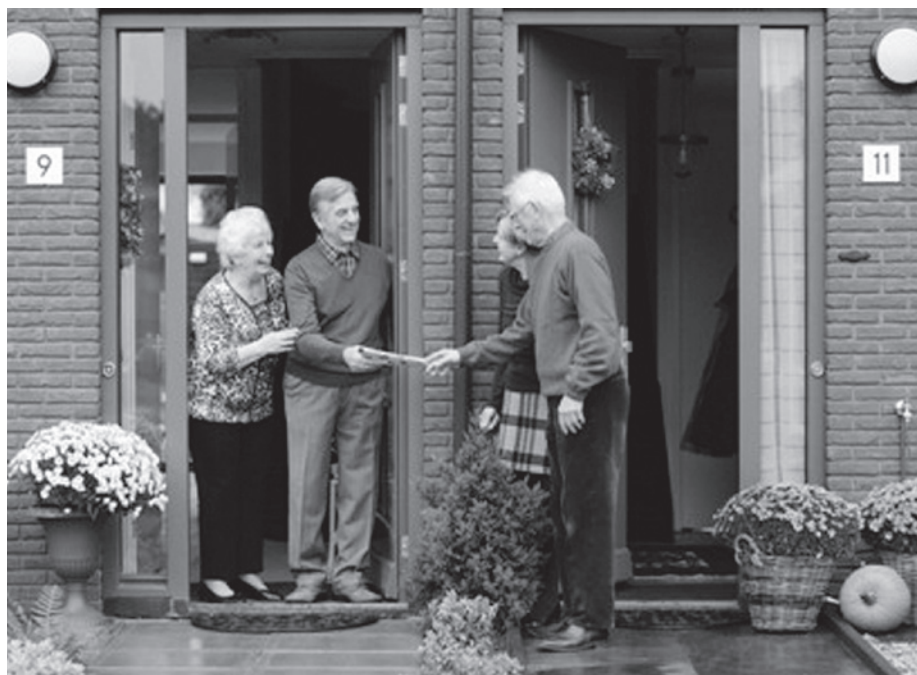
'Beter een goede buur dan een verre vriend'

In een modezaak op de Zwart Janstraat sta ik in de rij bij de kassa. Twee jonge vrouwen voor me kwebbelen uitgebreid en ik vang hun gespreksonderwerp op: de burens. "Ik ben jaloers op jou, jij hebt zulke leuke burens." zegt de vrouw met de rode bloes tegen die met de blauw-gestreepte. "Ze passen soms op je kind en jullie gaan samen sporten en zo. Terwijl ik van die snertmen-sen naast me heb wonen." Haar vriendin beaamt de goede band met haar burens en vraagt wat er mis is aan die van haar. Dat legt ze met een scherpe stem uit: "Nou, ze zetten áltijd hun auto bij ons voor de deur, die pubers van haar stampen en gooien met de deur en tot 's avonds laat hoor je geklak van hakken die heen en weer gaan!" Ze heeft er een paar keer over geklaagd, maar de burens reageerden chagrijnig en er veranderde niets. Ze baalt ervan en verwacht niet dat die burens rekening met haar gezin willen houden.