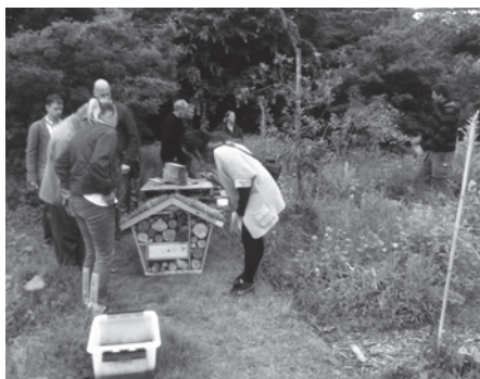
De Groene Loper in Noord – pagina 5