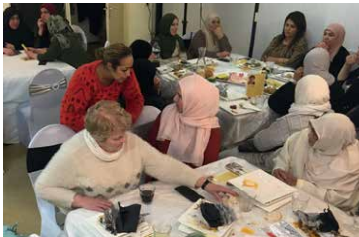
De vrouwengroep kwam op 9 maart bij elkaar voor de Internationale Vrouwendag

Op woensdagochtenden komen vrouwen van verschillende culturen in de Vrije Ban bij elkaar, vanaf 8.30 uur als de kinderen naar school gebracht zijn.