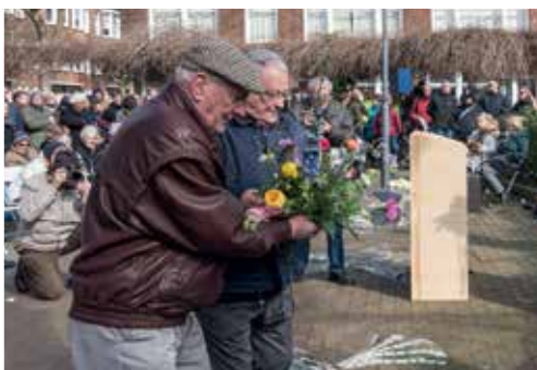
Herdenking V1 pag. 6 - 8