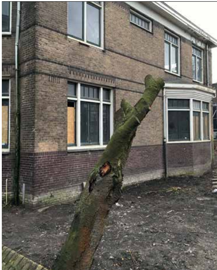
De gekapte bloesemboom in de tuin van de kerk