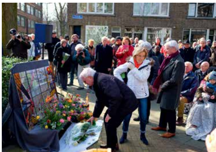
Na 2 minuten stilte voor de slachtoffers werden bloemen gelegd bij het tijdelijke monument