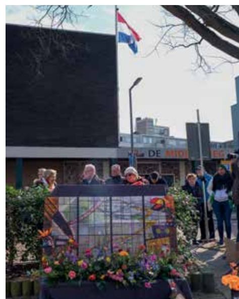
Het glas-in-loodraam uit de moskee als tijdelijk monument