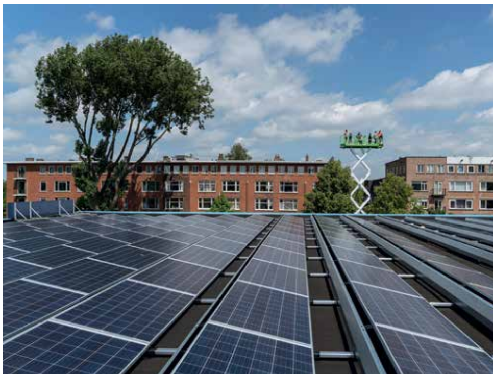
Het zonnedak op de gymzaal van de scholen op de Noorderhavenkade

Die investering verdient je terug. Na maximaal 11 jaar pak je zelfs rendement. Hoe gaaf is dat: je maakt winst door Rotterdam en de