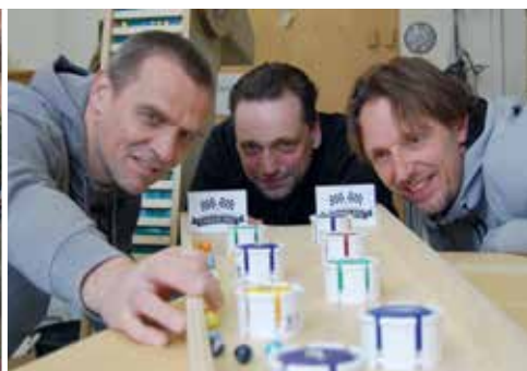
Knikkerbaan van 60 meter pag. 12