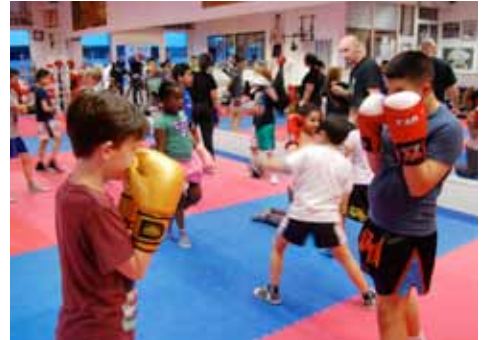
Boksen om de hoek pag. 15