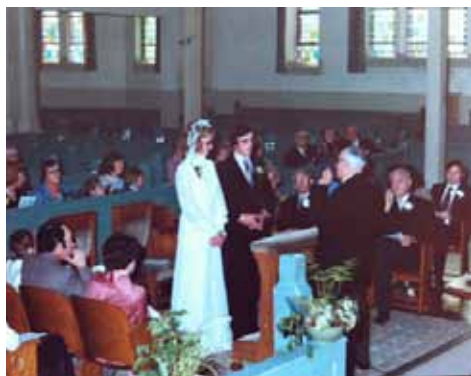
Huwelijk in de Bergsingelkerk in de jaren zeventig

Op 8 april is het precies 100 jaar geleden dat de Bergsingelkerk in Rotterdam officieel werd geopend. Het is het enige overgebleven kerkgebouw van de Gereformeerde Kerk te Rotterdam (Centum en Noord). De andere kerken zijn gesloopt of verkocht. Het 100-jarig bestaan wordt feestelijk gevierd met een reünie en een jubileumdienst.