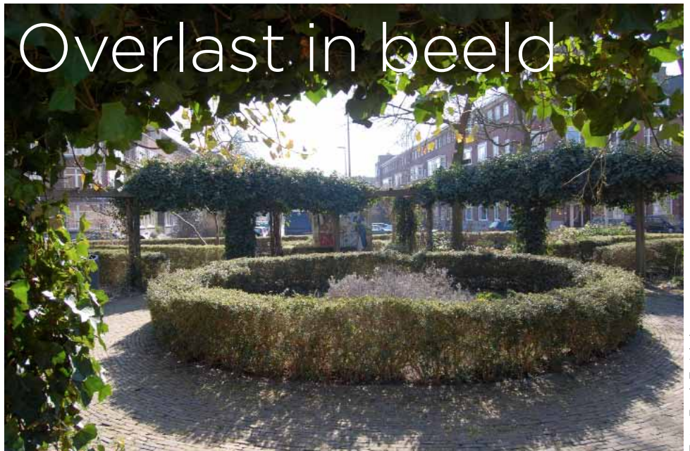
Pergola op de De Savornin Lohmanlaan

Eind januari is op een speciaal georganiseerde bewonersavond aan de bewoners gevraagd naar de actuele overlast. De uitslag was positief.