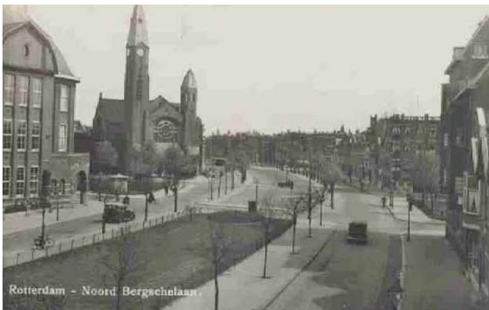
Bergsingelkerk in 1935