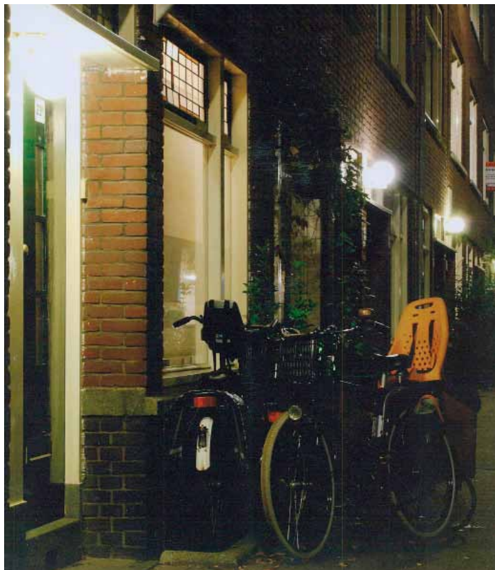
Bergpolder Verlicht en Veilig