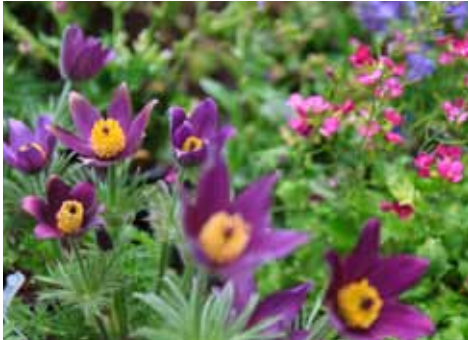
Geveltuintag pag. 3

Wijkkrant voor en door bewoners / nummer 2 / april 2015