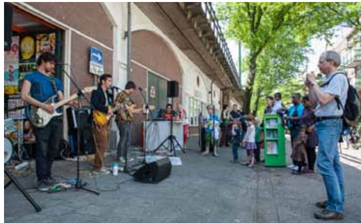
Het Langste Podium in 2014

Kijk op www.rotterdam.nl/product:bijdragebewonersinitiatief