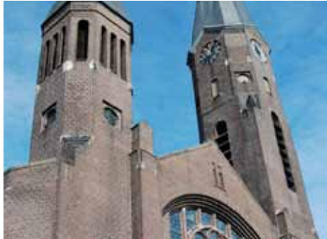
Bergsingelkerk 100 jaar pag. 8 en 9