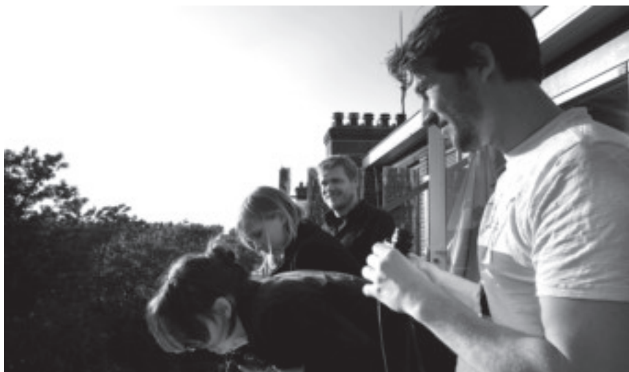
Speuren met een verrekijker bij de sterrenkijker.