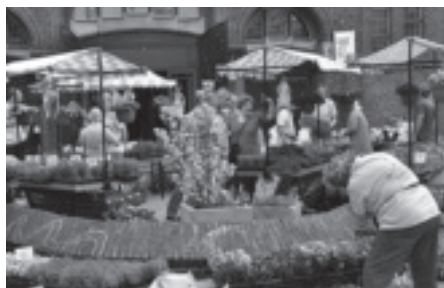
Dank aan alle bezoekers van onze jaarlijkse geraniummarkt op het plein voor de kerk op zaterdag 7 mei.