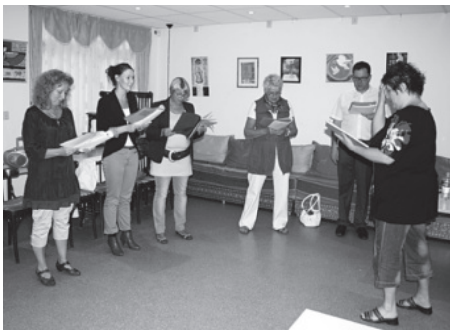
Theatergroep Bergpolder repeteert het nieuwe theaterspektakel.