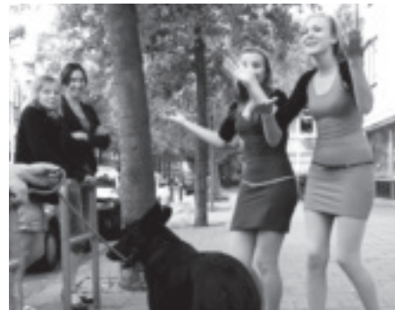
Theaterproject Bij de Buren Gluren – pagina 18