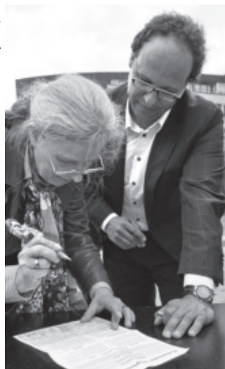
Kamerlid Wouter Koolmees tekent voor adoptie van Bergpolder.