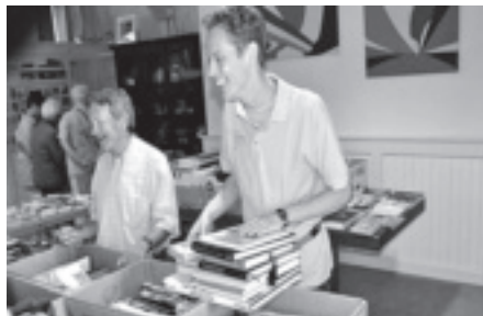
Elke laatste zaterdagmiddag van de maand is er boekenmarkt in de Bergsingelkerk.