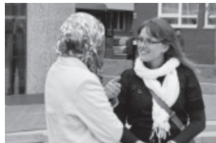
De antropologe interviewt een bewoner op straat.

als fanatiek en ze werden vaak in verband gebracht met de aanslagen van 11 september. Er was dus echt iets aan de hand in Nederland”, zo verklaart Long de keuze voor haar onderzoeksgebied. “Moslimimmigranten zijn absoluut zichtbaarder geworden. Maar ik vond hier in de buurt weinig bewijs voor gestegen cynisme en wantrouwen”, is haar voorlopige conclusie.