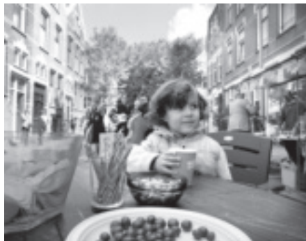
Schieveenstraat: Klimaatstraat nr. 1 – pagina 11