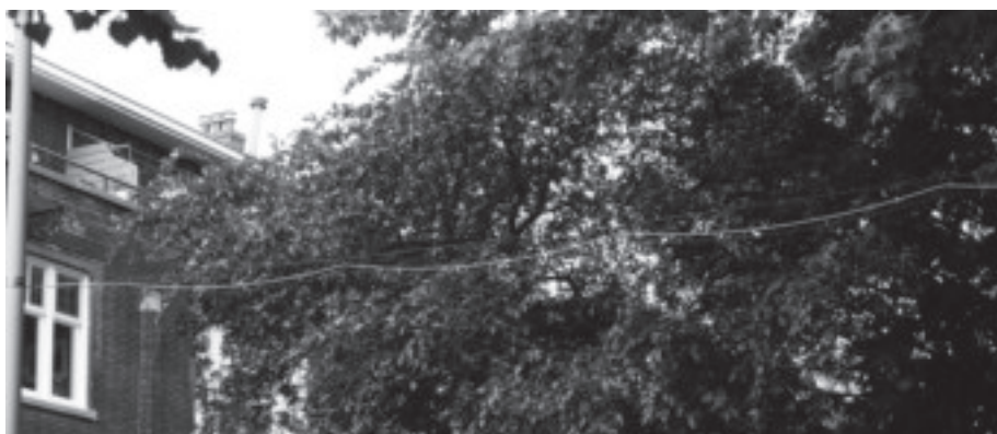
De kabel loopt door het park aan de Tak van Poortvlietstraat.

Juist daarom hebben de onderzoekers gekozen voor de Berkelselaan als onderzoeksplek. Er is water (de Bergsingel) en een park (Tak van Poortvlietstraat), met daartussen straten met weinig groen. Door de verdamping van het water en de schaduwwerking verwachten ze dat het bij de singel en tussen