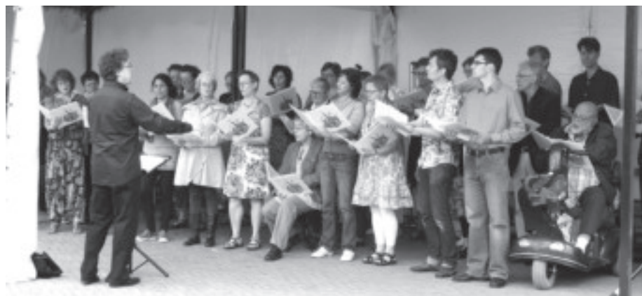
Het MultiCultiKoor zingt op het wijkfeest Kloppend Hart Insulindeplein.