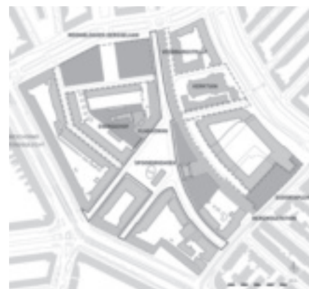
Overzichtskaart van het plangebied uit het concept-masterplan.