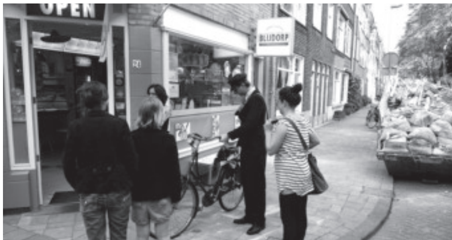
De postbode ontmoet publiek bij de snackbar.