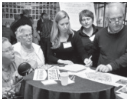
Bergpolder-Zuid: de laatste ronde – pagina 3