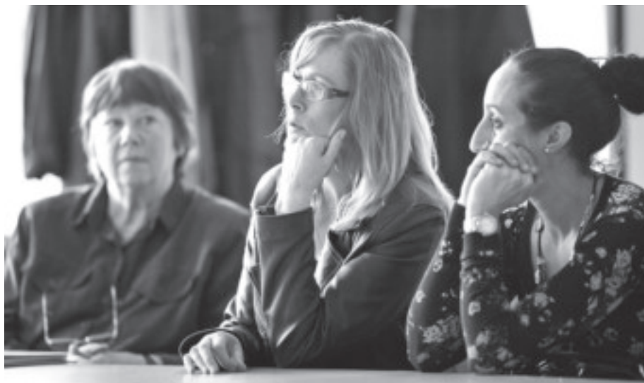
Bewoners van de PWS-blokken zitten voorlopig in onzekerheid.

Op de laatste debatavond over het plan waren zeker niet alle bewoners even enthousiast. "In de Voorburgstraat krijgen we straks nauwelijks zon meer", zeiden sommigen nadat ze hadden gezien hoe hoog de nieuwe Spoordriehoek wordt. Over het verschil in hoogte met het oude pand konden de planners ook weinig duidelijkheid geven: er komen drie bouwlagen bovenop het huidige aantal van vier en de totale hoogte wordt volgens het masterplan 22,5 meter. "Dus de ene helft van de wijk wordt in de schaduw gezet, terwijl de andere helft kan vertrekken. Voor wie doen jullie dit eigenlijk?", zo vatte een bewoner van de voormalige PWS-blokken de onrust samen. De gebouwen heten inmiddels de Bergselaan-