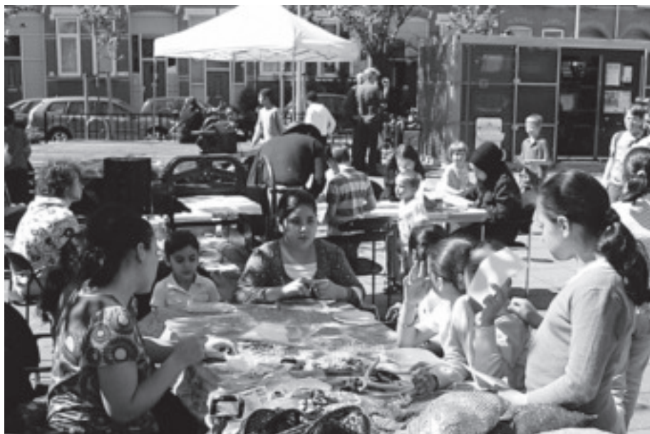
"Liskids Koninginnedagfeest 2009 was een ongekend succes"

Binnenkort ontvangen alle buurtbewoners weer een uitnodiging, mét een kaartje voor de Liskidsballonnenwedstrijd, dus houd uw brievenbus in de gaten! Kinderen die iets bijzonders willen doen op het open podium kunnen zich aanmelden bij Liskids: alles mag, behalve playback.