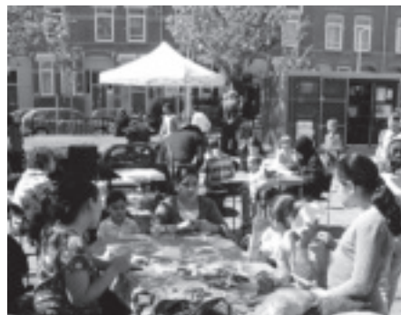
5 mei Koningsveldeplein