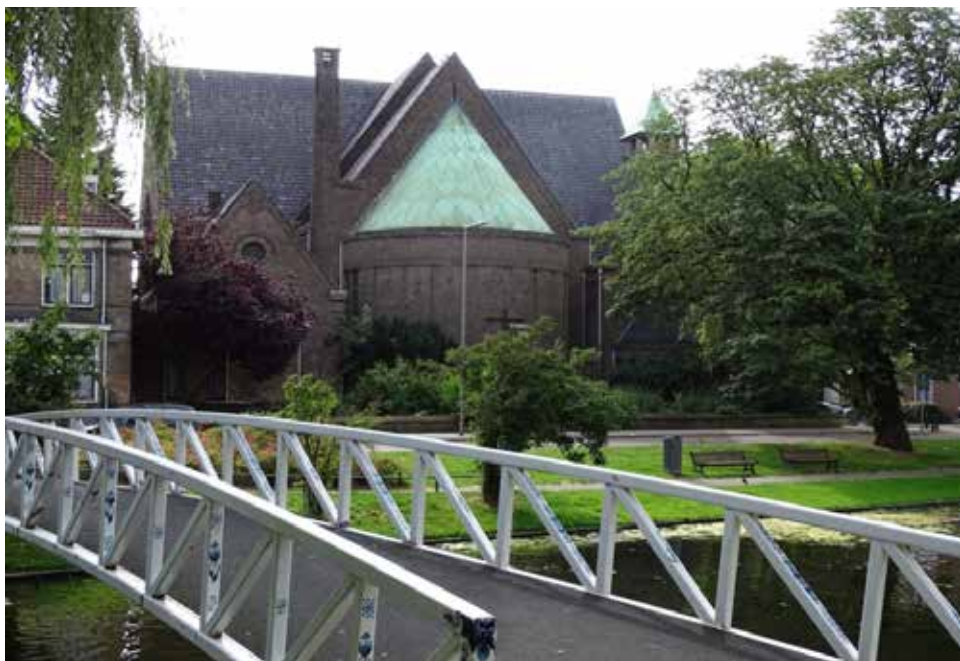
Heilige Familiekerk aan de Bergsingel

CityKids wil graag het zorgaanbod uitbreiden. In de Heilige Familiekerk hebben ze een prachtige plek gevonden om dit te realiseren. Als ze volgend jaar in de Familiekerk gehuisvest zijn, wil CityKids een kindergezondheidscentrum voor het chronisch zieke kind en zijn familie beginnen. Voor poliklinische zorg en dagbehandeling, die nu nog veelal in het ziekenhuis plaatsvinden, kunnen families straks gewoon de kinderarts en andere disciplines in de Familiekerk bezoeken.