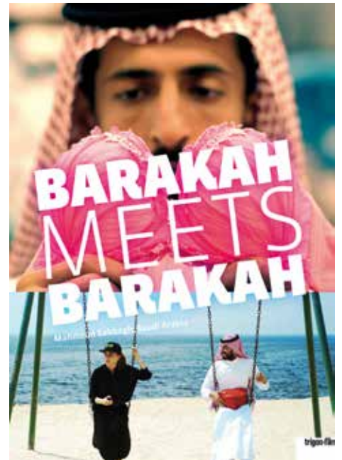
De openingsfilm van het festival

"Ik ben aan de start van ieder festival druk in de weer met de fondsenwerving en houd continu een oog op het te besteden budget. Ik leg de contacten met de bioscoop, techniek, catering, randprogrammering, stuur de communicatie aan, heb contact met filmmakers en distributeurs voor het leveren van de films en regel zo erg veel zaken aan elkaar. Daarnaast initieer ik allerlei samenwerkingen vanuit het netwerk