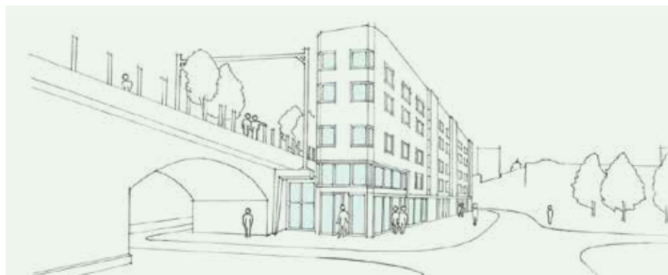
Een eerste schets van de nieuwe Spoorpunt