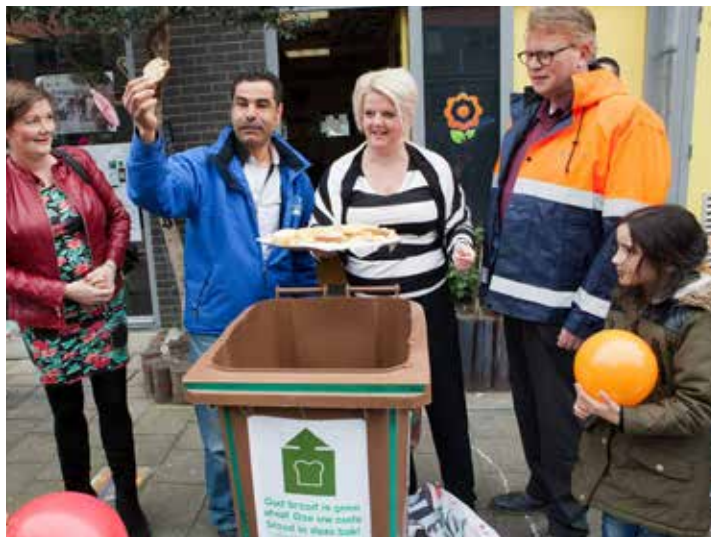
Brood kan in de broodbak worden gedaan

Een vereniging in Bergpolder is al kandidaat om een broodbak te