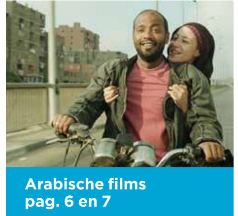
Arabische films pag. 6 en 7