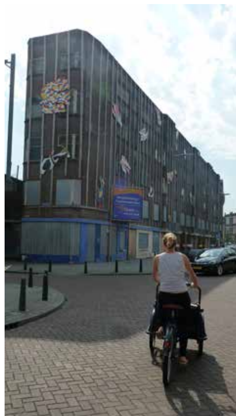
De huidige Spoorpunt in de Insulindestraat

Onder het motto "Casco doen wij, de rest doe jij" wordt begonnen met workshops, al voordat men een woning kan kopen. Tijdens de workshops wordt in overleg met de architect aan het ontwerp vorm gegeven: de indeling van het gebouw, de uitgangspunten van het casco-ontwerp en zaken als buitenruimte, en entree worden in grote lijnen vastgelegd. Pas daarna wordt het project specifiek uitgewerkt en kan de start van de verkoop van de appartementen beginnen. De historische vergissing om zo dicht op een spoorbaan te bouwen, kan omslaan in een unieke kans; als de wens van veel bewoners werkelijkheid wordt en het dak van de Hofbogen een groene bestemming krijgt, wie wil daar dan niet wonen: in het groen, dicht bij voorzieningen en bovendien dicht bij alles wat het centrum van de stad kan bieden.