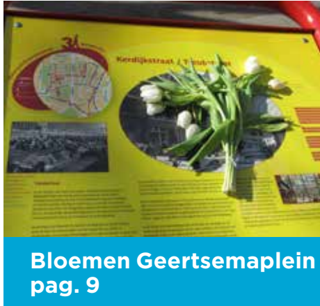
Bloemen Geertsemplein pag. 9