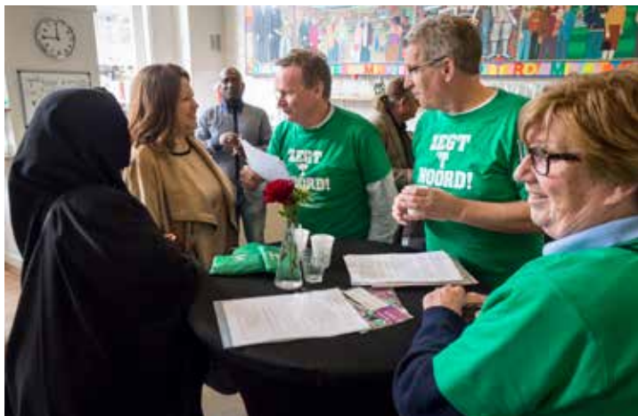
Gebiedscommissieleden denken mee over uw ideeën voor de wijk

Op 8 oktober kunt u weer langskomen bij Initiatiefrijk Noord, het snelloket voor bewonersinitiatieven. Aanvraag en beoordeling van uw ingediende initiatief kan op dezelfde dag geschieden. Voor Noordelingen die alleen nog maar een idee hebben kunnen in aanloop naar 8 oktober langskomen bij één van de inloopsessies, die in september in de wijken worden georganiseerd.