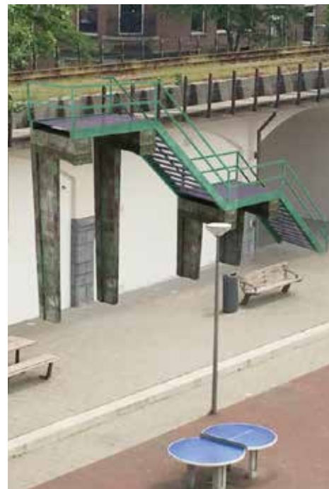
Artist impression van gaffels als ondersteuning van een trap

diverse workshops meer ideeën voor hergebruik verzamelen bij alle buurtbewoners van jong tot oud. Voor onderzoek naar de technische en functionele mogelijkheden willen we in oktober een bewonersinitiatief indienen waarvoor we uw handtekening nodig hebben. Als u het project wilt ondersteunen, zelf ideeën heeft voor de gaffels of aanwezig wilt zijn op een van de workshops, stuur een e-mail naar: hofbogevenementen@gmail.com .