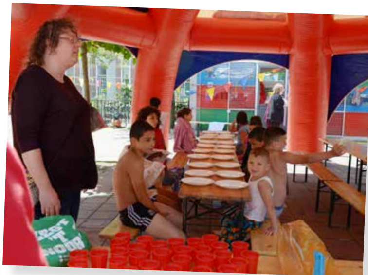
Lekker met z'n allen lunchen