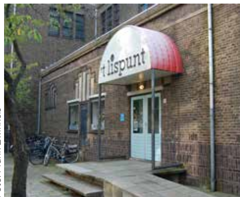
De oude ingang van 't Lispunt