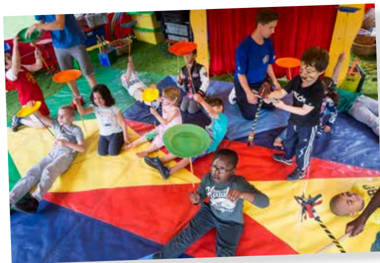
Schotels balanceren bij Circus Hannes