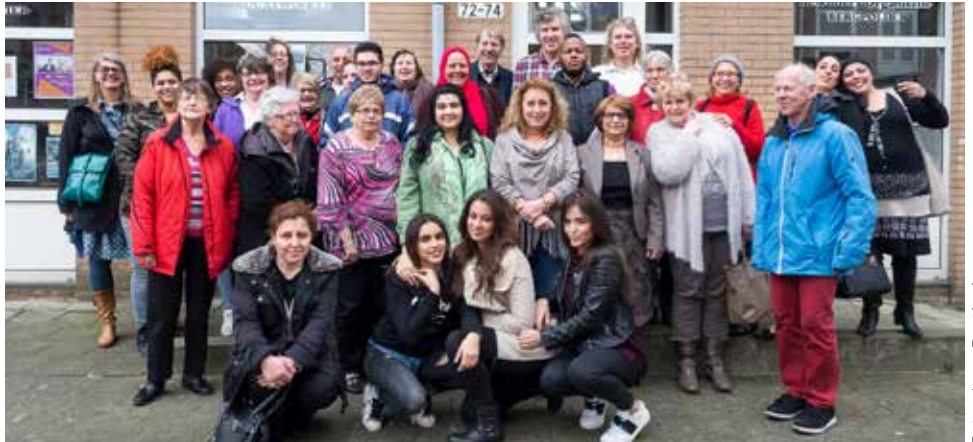
Vrijwilligers van de bewonersorganisaties samen met andere vrijwilligers uit de wijk

Door de subsidiestop zullen sommige andere bewonersorganisaties per 1 januari 2017 hun deuren sluiten. Bewonersorganisaties Bergpolder en Liskwartier denken na over hun toekomst.