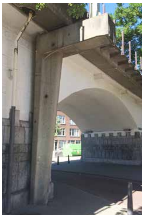
De betonnen gaffel bij de onderdoorgang van de Hofpleinlijn in de Voorburgstraat

Naar verwachting zullen in 2017 delen van de Hofpleinlijn worden ontmanteld. De spoorrails en bielzen die op het dak liggen zullen worden verwijderd. Dat geldt ook voor de stalen portalen die de elektriciteitsdraden van de bovenleiding droegen en voor de betonnen pilaren naast het viaduct waar de portalen op staan, ook wel gaffels genoemd.