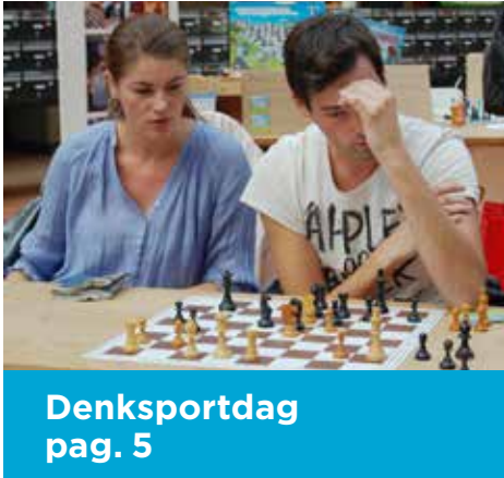
Denksportdag pag. 5

Wijkkrant voor en door bewoners / nummer 8 / september 2016