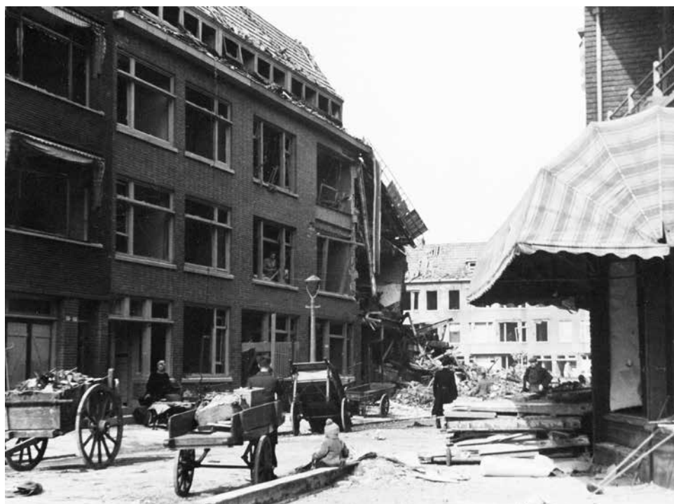
De ravage in de Treubstraat gezien vanaf de Bergselaan