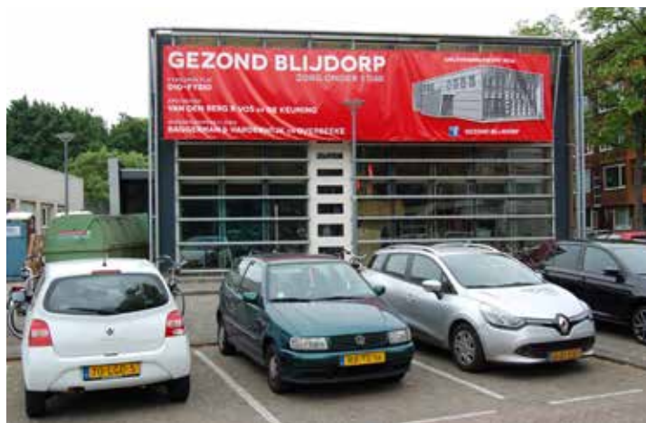
Het nieuwe gezondheidscentrum Gezond Blijdorp aan het Stadhoudersplein

Als alle volgens plan verloopt, zal het nieuwe gezondheidscentrum 'Gezond Blijdorp' aan het Stadhoudersplein 37 eind juni haar deuren openen.