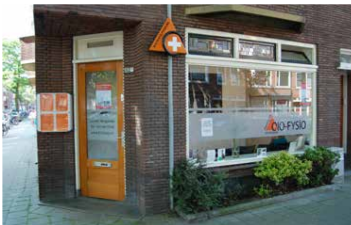
Fysiotherapiepraktijk O10-Fysio verdwijnt uit de Abraham Kuyperlaan

Het gezondheidscentrum heeft een gescheiden ingang naar de bovenetage voor de huisartsen en naar de benedenverdieping voor de apotheek en de fysiotherapeuten.