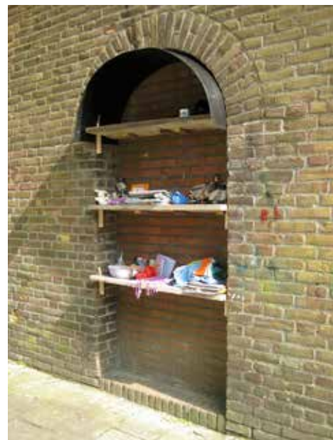
Weggeefkast Bergpolder is in mei opgeknapt

In mei heeft iemand een nieuwe weggeefkast gemaakt en in de nis geplaatst. Ik houd hoop dat niemand opdracht geeft tot sloop!