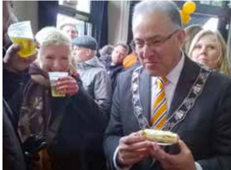
Koningsdag Liskwartier met Aboutaleb pag. 13