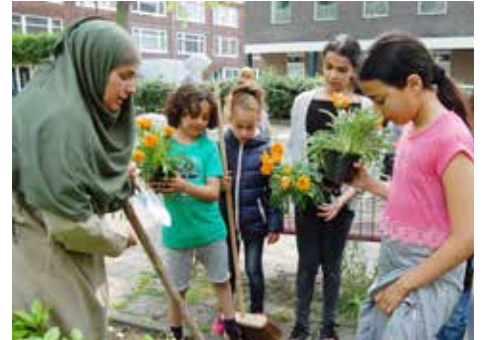
Centrum de Middenweg en haar burens pag. 16