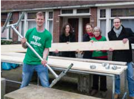
Buurttafel Talmastraat pag. 7

Wijkkrant voor en door bewoners / nummer 7 / juni 2016