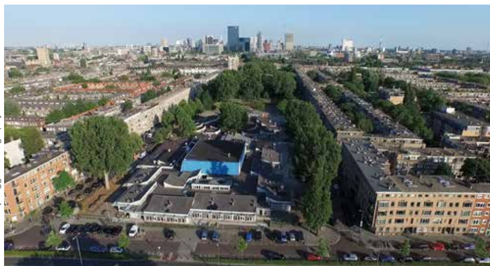
De gymzaal aan de Noorderhavenkade in blauw