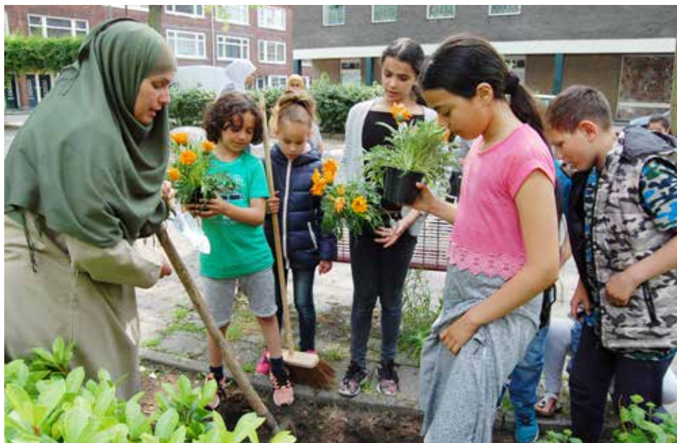
Kinderen van De Middenweg onderhouden de perken op het Geertsemaplein