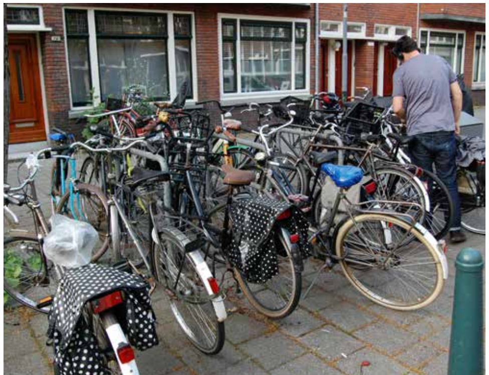
Slechts drie fietsenrekken voor zeventien fietsen!