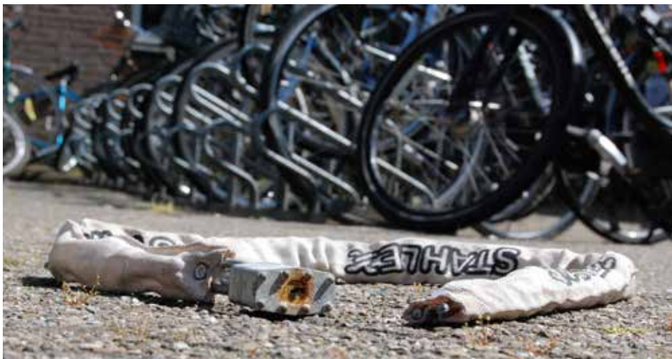
Weer een fietsslot doorgeknipt

Laat een diefstalpreventiechip op of aan de fiets aanbrengen. Dit is een klein staafje