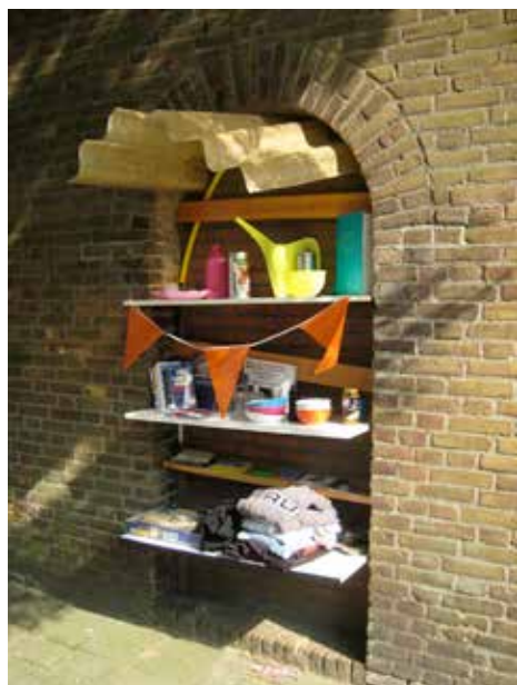
Weggeefkast Bergpolder voor de sloop