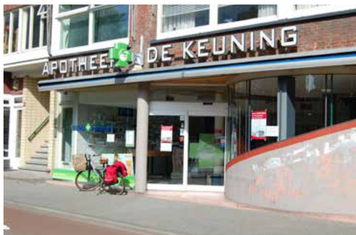
Apotheek De Keuning verhuist ook naar Gezond Blijdorp

Nieuw bij de apotheek is een uitgifteloket waar u met een code 24 uur per dag uw medicijnen kunt afhalen. De medicijnen die u op deze wijze afhaalt moeten wel op de normale wijze op werkdagen tijdens de openingstijden van de apotheek worden aangevraagd.