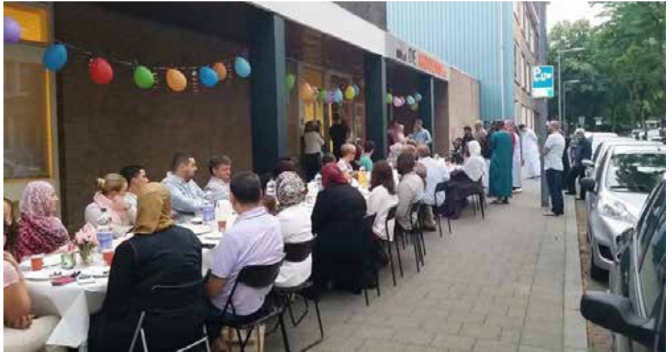
Burens schuiven aan bij de iftar van De Middenweg