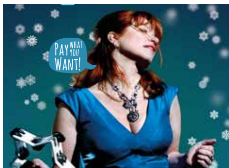
Funky Jazz Christmas show pag. 5

Wijkkrant voor en door bewoners / nummer 9 / december 2016