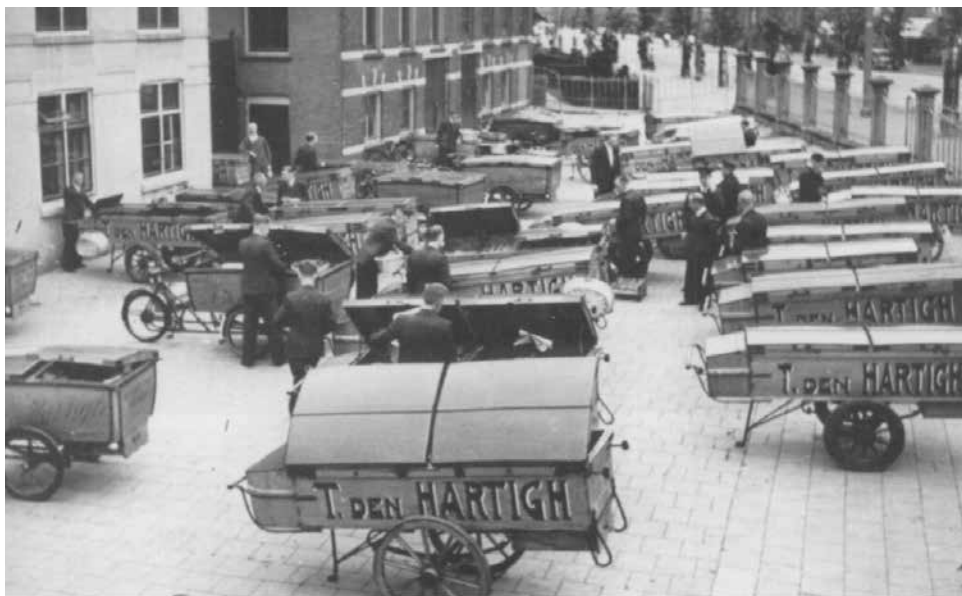
De broodkarren van Den Hartigh Bakkerijen