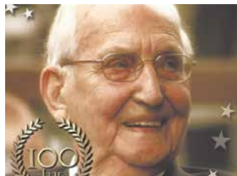
100-jarige wijkbewoner pag. 8